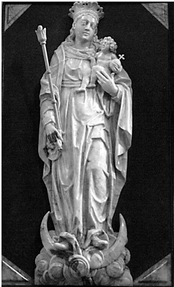
(na zdj.: Figura Matki Bożej Mazowieckiej)

26 maja swoje święto będą miały wszystkie matki. W Polsce ten uroczysty dzień obchodzimy od 1914 roku. Choć nie jest to święto kościelne, to katolicy mają swoje powody, by ten dzień uważać za godny szczególnego celebrowania, bowiem oprócz matek, które nas urodziły i wychowały, Jezus na krzyżu ofiarował nam swoją matkę – Maryję.